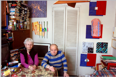
HERB & DOROTHY di MEGUMI SASAKI Stati Uniti, 2009, 87'

Il film racconta l'incredibile storia di come un semplice impiegato delle poste, Herbert Vogel, e sua moglie Dorothy, una bibliotecaria, siano riusciti a mettere insieme una delle collezioni di arte contemporanea più importanti degli Stati Uniti, costituita da oltre 2000 pezzi e valutata svariati milioni di dollari. In un mondo dove spesso il valore economico si sostituisce a quello artistico, la loro storia dimostra che la visione e l'istinto sono ancora più importanti del denaro.