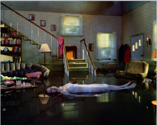
GREGORY CREWDSON: BRIEF ENCOUNTERS di BEN SHAPIRO Stati Uniti, 2012, 79'

Per dieci anni Ben Shapiro ha seguito il lavoro del fotografo americano Gregory Crewdson, osservandolo nel ruolo di regista delle sue crepuscolari immagini-quadro, realizzate allestendo veri e propri set cinematografici. Riprendendo tutte le fasi del progetto Beneath the Roses , il regista ci offre un'affascinante panoramica sull'elaborazione tecnica delle opere di Crewdson, approfondendone con l'artista i risvolti psicologici ed emotivi.