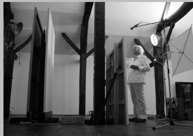
OPALKA - ONE LIFE, ONE OEUVRE di ANDRZEJ SAPIJA Polonia, 2011, 54'

Artista, ma anche curatore e collezionista, recentemente celebrato dalla Tate Modern di Londra con una grande mostra retrospettiva, Damien Hirst si racconta consegnandoci un inusuale autoritratto, impreziosito da fotografie e filmati originali provenienti dal suo archivio privato.