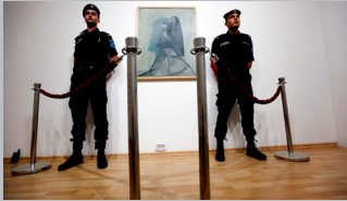
PICASSO IN PALESTINE di RASHID MASHARAWI Palestina, 2012, 52'

L'artista Khaled Hourani ha impiegato due anni per realizzare il suo progetto di esporre, per la prima volta nella storia, un'opera di Picasso a Ramallah. Il film, presentato a Documenta 13, è parte integrante di questo progetto e racconta il viaggio del dipinto Buste de Femme (1943), dal Van Abbemuseum di Eindhoven agli spazi dell'International Academy of Art of Palestine e ritorno, passando per le numerose difficoltà burocratiche e logistiche affrontate dagli organizzatori della mostra, aperta al pubblico nel giugno 2011 e divenuta un vero e proprio caso.