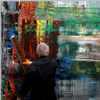
GERHARD RICHTER PAINTING di CORINNA BELZ Germania, 2011, 97'

Protagonista nel 2011 di una grande mostra retrospettiva organizzata dalla Tate Modern di Londra per celebrare i suoi ottant'anni, Gerhard Richter è uno dei maestri più affascinanti e schivi della pittura contemporanea. Testimone privilegiata della creazione di un ciclo di opere astratte, la regista realizza un intenso ed esclusivo ritratto dell'artista filmandolo al lavoro nel suo studio, dialogando con lo stesso e seguendolo nei suoi colloqui con la gallerista newyorkese Marian Goodman e lo storico dell'arte Benjamin H.D. Buchloh.