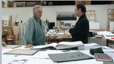
HOW TO MAKE A BOOK WITH STEIDL di JÖRG ADOLPH, GEREON WETZEL Germania, 2010, 88'

Gherard Steidl è uno dei più importanti editori specializzati in libri d'arte, di fotografia e di moda. In oltre quarant'anni di attività dal suo laboratorio di Göttingen hanno visto la luce alcune delle opere editoriali più significative di