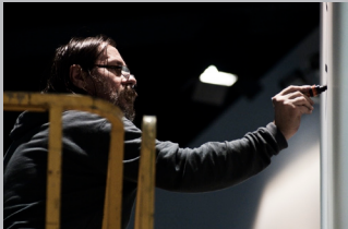
DAN PERJOVSCHI SOLO IN ROME di MILO ADAMI Italia, 2012, 23'

Intervistato in occasione della sua prima mostra personale italiana, intitolata The Crisis is (not) Over: Drawings and Dioramas , l'artista rumeno Dan Perjovschi parla della sua storia e delle origini del suo lavoro, concedendosi alla telecamera e allo sguardo del pubblico mentre anima con i suoi pungenti disegni le pareti del Museo MACRO di Roma.