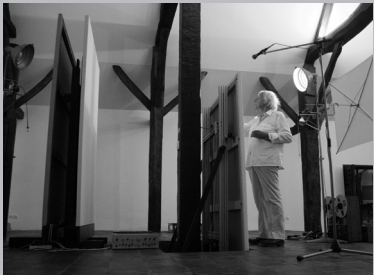
OPALKA - ONE LIFE, ONE OEUVRE di ANDRZEJ SAPIJA Polonia, 2011, 54'

Artista, ma anche curatore e collezionista, recentemente celebrato dalla Tate Modern di Londra con una grande mostra retrospettiva, Damien Hirst si racconta consegnandoci un inusuale autoritratto, impreziosito da fotografie e filmati originali provenienti dal suo archivio privato.