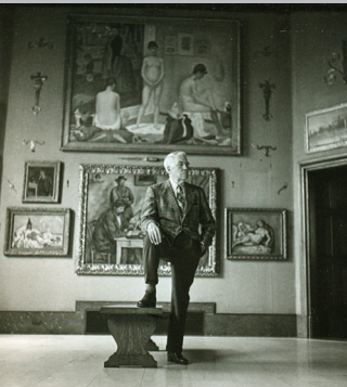
THE ART OF THE STEAL di DON ARGOTT Stati Uniti, 2009, 101'

Il Dott. Albert C. Barnes istituì nel 1922 una Fondazione destinata a promuovere i valori fondamentali dell'arte attraverso lo studio e la tutela della sua straordinaria collezione di opere del XIX e del XX secolo. Il film ricostruisce attraverso innumerevoli interviste e documenti come un ristretto gruppo di persone abbia sistematicamente cercato negli ultimi anni di acquistare il controllo della Fondazione per spostare la collezione di Barnes, valutata oltre 25 miliardi di dollari, in una nuova sede museale nel centro di Filadelfia.