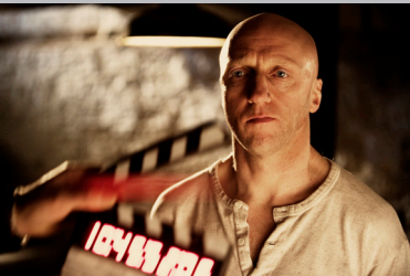
SELF MADE di GILLIAN WEARING Regno Unito 2010, 88'