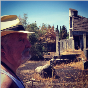
PER TROPPO AMORE: INCOMPIUTO SICILIANO di ALTERAZIONI VIDEO Italia, 2012, 21'

Una soap-opera psichedelica ambientata nel Parco Archeologico dell'Incompiuto Siciliano a Giarre. A causa di un guasto meccanico un extraterrestre (Marc Augé) decide di incarnarsi in un cane per poter passare inosservato e poter ispezionare il pianeta che lo ospita. Nel frattempo nel paese si è in procinto di organizzare una grande festa per l'inaugurazione ufficiale del nuovo parco archeologico dell'Incompiuto Siciliano.