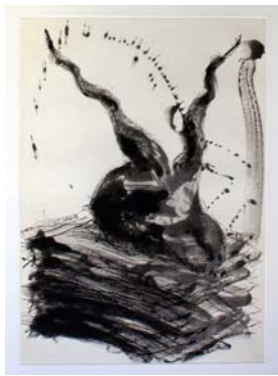
Miquel Barceló, Sin Titolo , 2012, incisione, cm 85 x 63, edizione n. 21 di 22