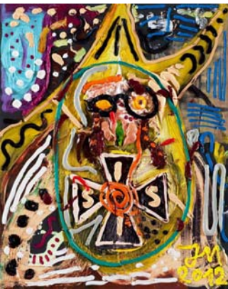
Jonathan Meese, DU BIST DER ELEMENTAR DWILLI MENSN', ES IST KLAR, KLAR WIE DWILLI MENSN'... , 2012, olio e acrilico su tela, cm. 100.5 x 80.4 x 3.3.