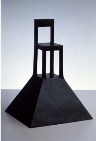
Alessandro Mendini, Lassù , 1983, bronzo, cm 29 x 19.5 x 20