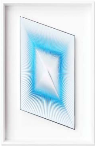
Alberto Biasi, Dinamica , 1981, lamelle di pvc su legno, cm. 42 x 20 x 3