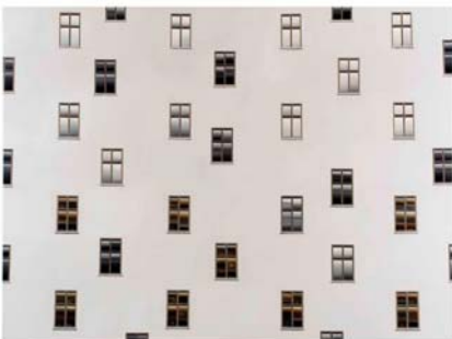
Bart Domburg, Senza Titolo , 2010, olio su lino, cm.150 x 200