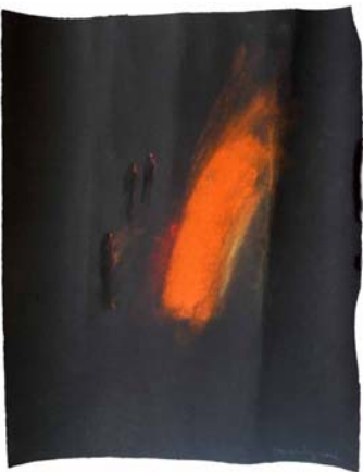
Claudio Parmiggiani, Senza titolo , anni '80, pastello su cartoncino nero, plexiglass cm. 52,5 x 40 x 7