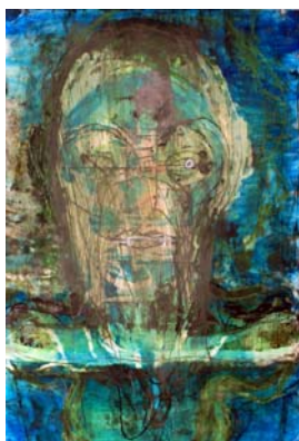
Huma Bhabha, Untitled , 2012, inchiostro su carta fotografica a colori, cm 30,5 x 21