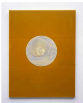
Domenico Bianchi, Senza Titolo , 2006, cera su fuberglas, cm 80 x 60