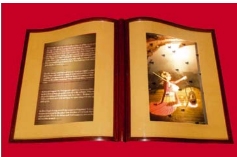
Sheba Chhachhi, Swara, Illuminated book , 2009, lightbox in legno, stampa digitale su duratrans (2 strati), cm. 62 x 104,5 x 17