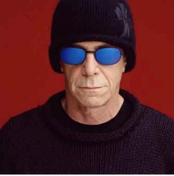
Timothy Greenfield Sanders, Lou Reed , fotografia a colori, cm. 42,7 x 47