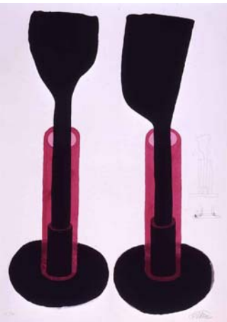
Ettore Sottsass, Lingam III , 2002, serigrafia, cm.65 x 91, edizione n. 10 di 30.