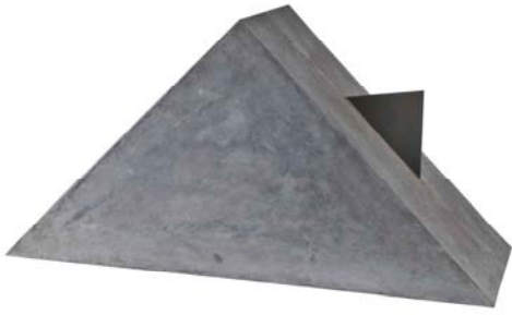
Mauro Staccioli, Senza Titolo , 1974, cemento e punta in ferro, cm. 49.5 x 29.2, esemplare n. 5 di 5