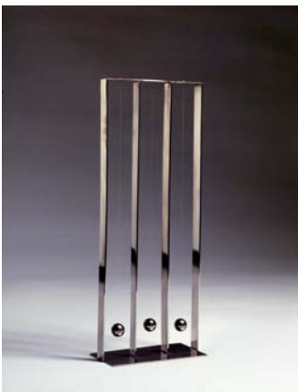
Fausto Melotti, Scultura A (I Pendoli) , 1968, inox, cm.h.40 x 15 x 8, esemplare 219 di 500