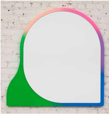
Greg Bogin, The not so distant future , 2009, vernice poliuretanicca su tela, cm 107 x 107