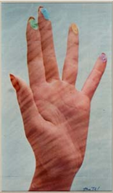
Mimmo Rotella, I cinque colori , 1972, effaçage, cm. 22 x 14,6