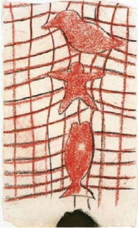
Francesco Clemente, Untitled , 1983-84, pastello su carta, cm. 49,5 x 29,2