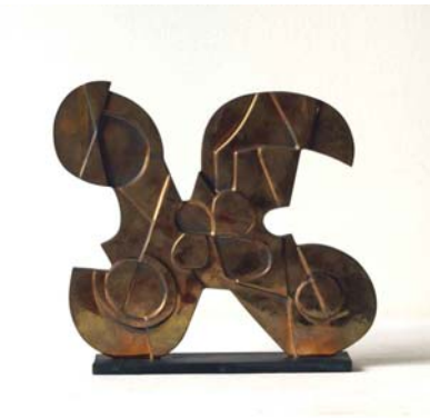
Pietro Cosagra, Trofeo , 1976, bronzo, cm. 24,5 x 26,5x 1,5, esemplare I / XXX